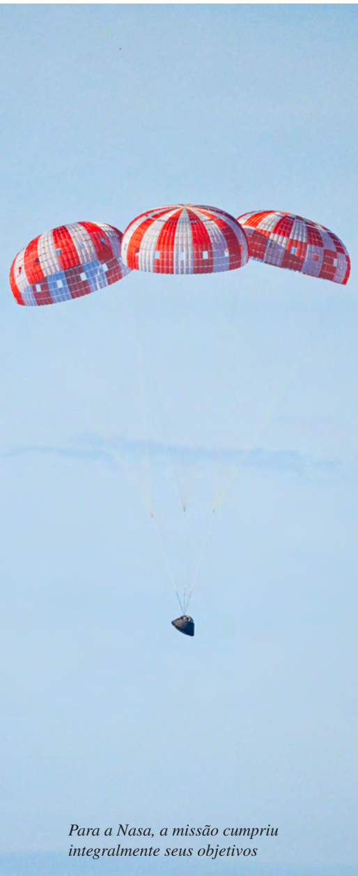
Para a Nasa, a missão cumpriu integralmente seus objetivos