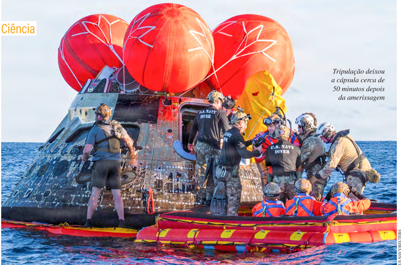
Tripulação deixou a cápsula cerca de 50 minutos depois da amerissagem