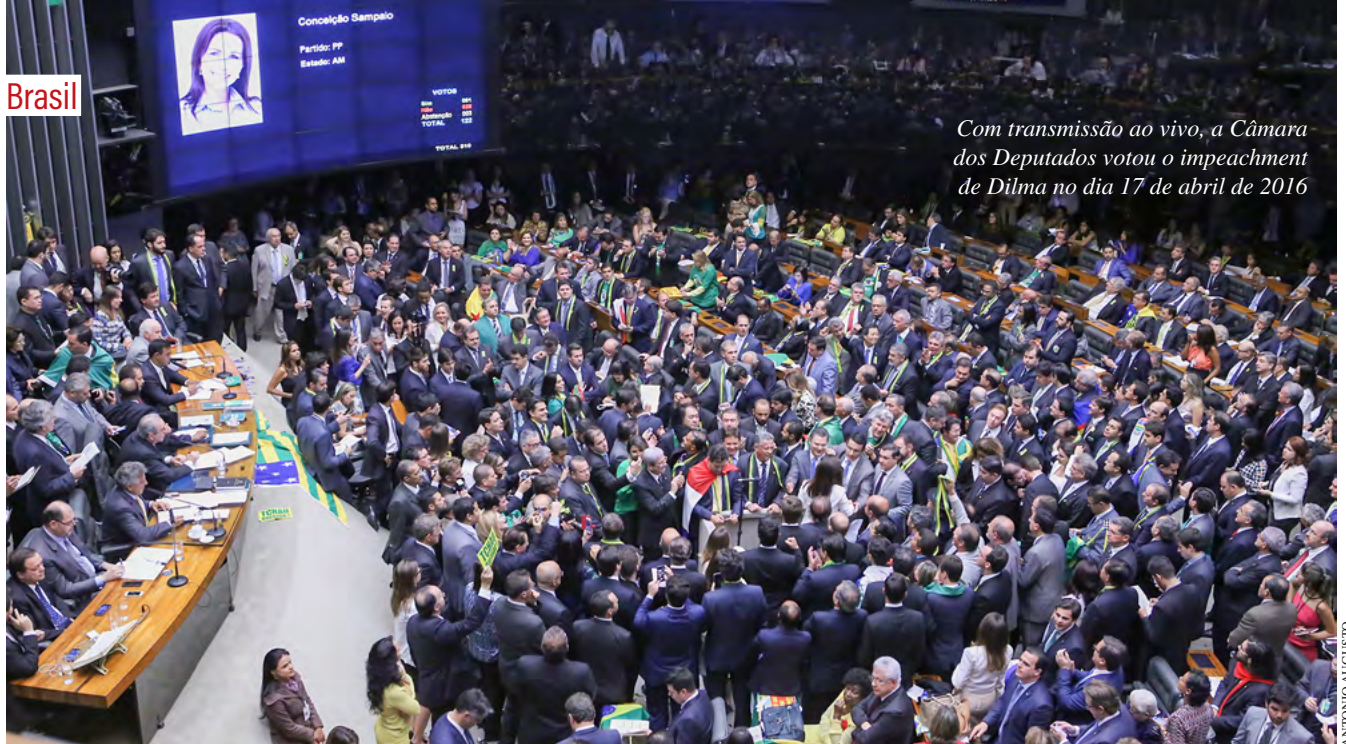
Com transmissão ao vivo, a Câmara dos Deputados votou o impeachment de Dilma no dia 17 de abril de 2016